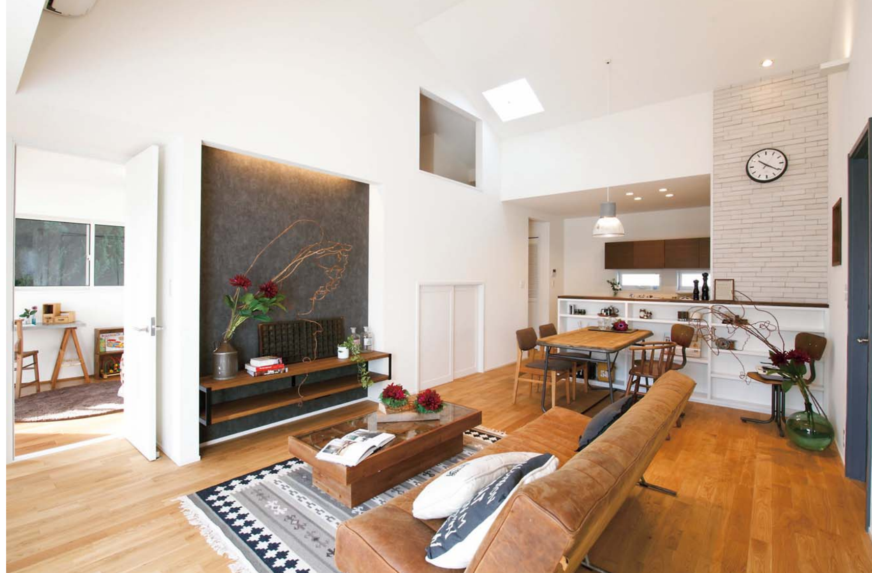
家族が集うLDKは天窓を設けた高さのある勾配天井で、平屋とは思えない開放感を演出