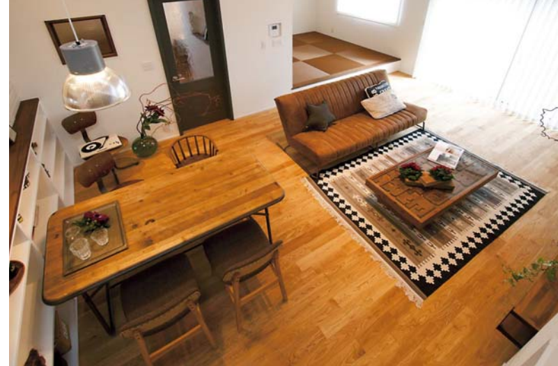
書斎から見下ろしたダイニング。どこにいても家族の気配を感じられる工夫が施してある