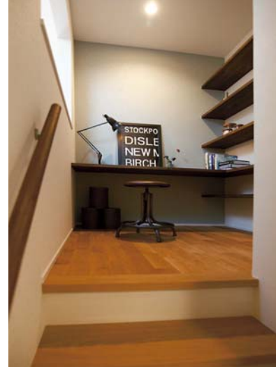
壁一面に造り付けの棚がある中2階の小部屋は、書斎や趣味スペースなど多目的に利用可