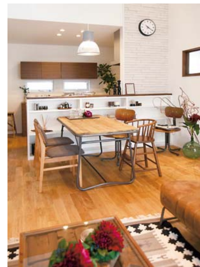
白×無垢材でナチュラルな雰囲気にまとめたダイニング。キッチン背面は造作の収納棚に