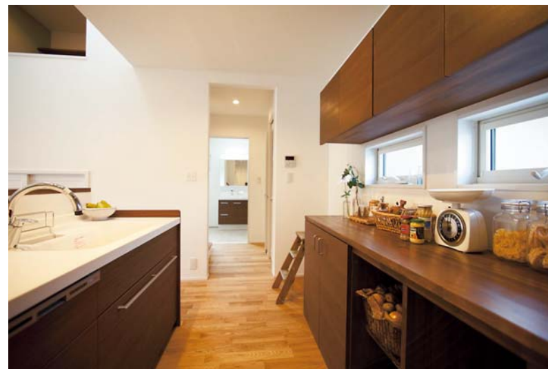
キッチンと横並びに水回りを集約したことで動線が短縮され、家事ストレスも大幅軽減