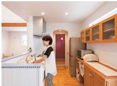
白く塗装した木に青いタイルを配したキッチン。アール壁の奥には大容量のパントリーが