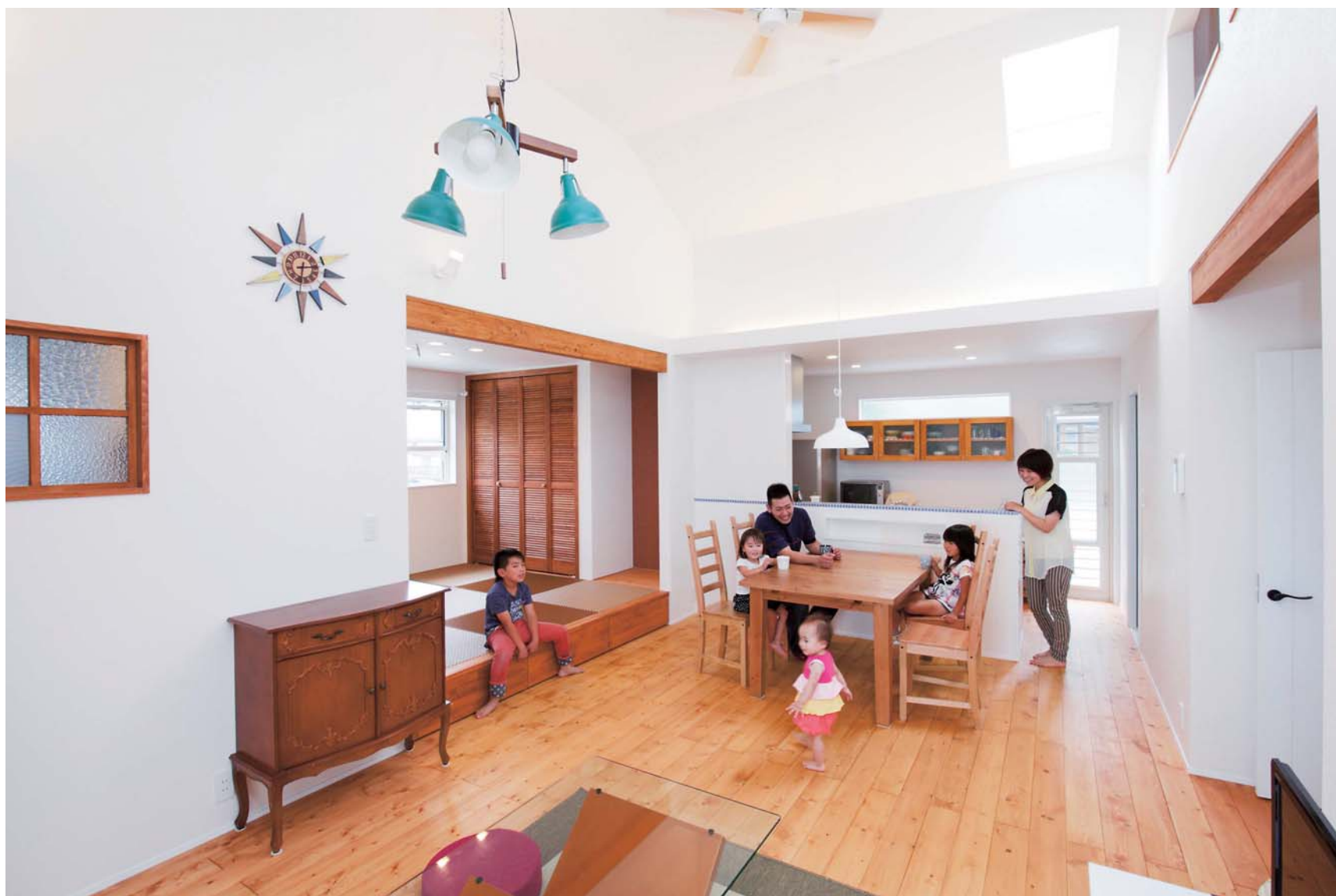
平屋とは思えない吹き抜けの開放感。天窓もあり、室内はいつも光にあふれて快適だ