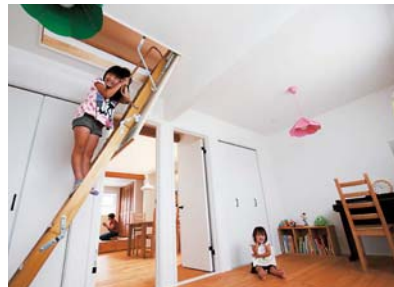
子ども部屋にはロフトを設けて空間を最大利用。階段は収納式でスッキリ片付くのも◎