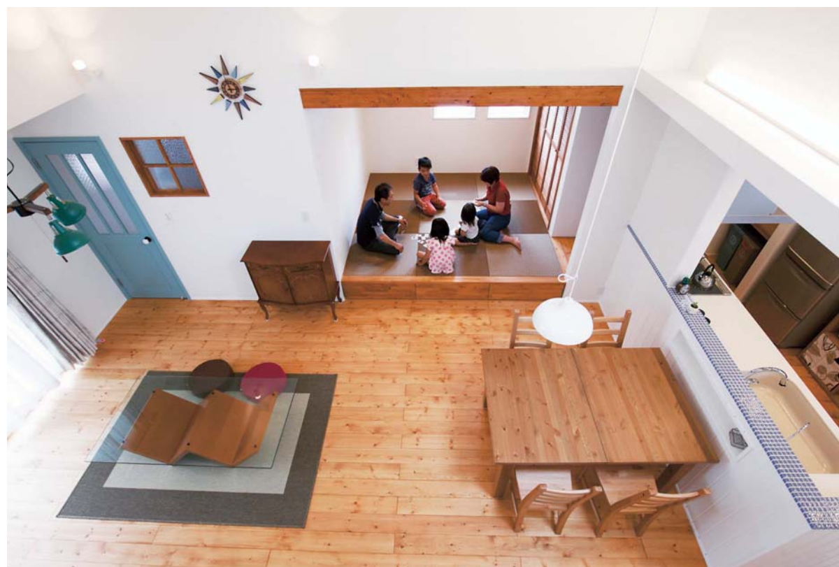
子育て世代に優しい、どこにいても家族の気配が感じられる一体感のある間取りが特長